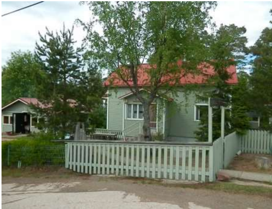
Kotkan latu ry:n toimipiste PETÄJÄPIRTTI Petäjäsuontie 34 Kotka 48400 Kotka